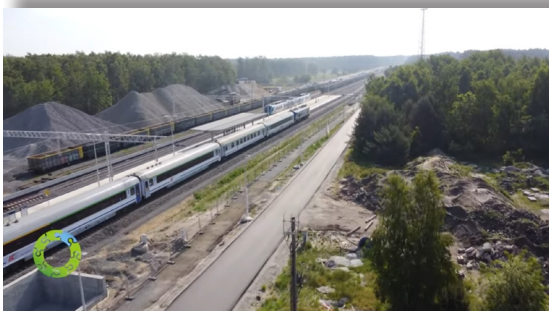
Podsumowanie roku w ZINTEGROWANYCH INWESTYCJACH TERYTORIALNYCH https://youtu.be/prHoxezIOUY

Odwiedzaj regularnie stronę Stowarzyszenia Szczecińskiego Obszaru Metropolitalnego http://som.szczecin.pl oraz Zintegrowanych Inwestycji Terytorial w.facebook.com/szczecinski.obszar.metropolitalny/ . Zapraszamy także do zapoznania się z filmowym rozszerzeniem tematów poruszonych w naszym E-biuletynie ZIT SOM!