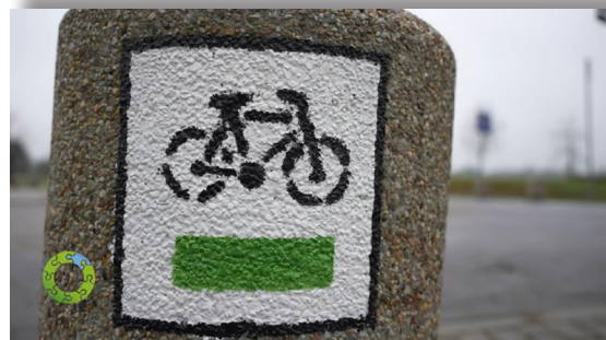
Ścieżki rowerowe rozwijają obszar metropolitalny https://youtu.be/BhhhYdKC38o