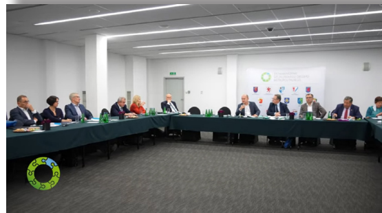
Spotkanie w sprawie Strategii Lokalnych https://youtu.be/C9UX30rwcgk