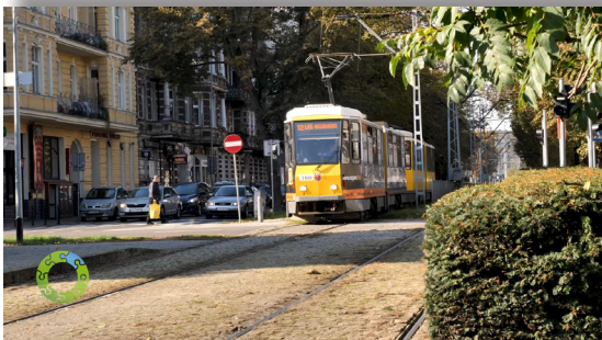
Mieszkańcy mają głos! Samochody czy komunikacja miejska? https://www.youtube.com/watch?v=d9qa5SKxxY8