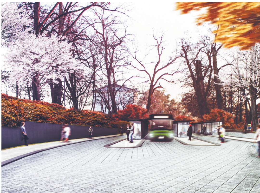
Nowe Zintegrowane Centrum Przesiadkowe w Gryfinie

Szczeciński Obszar Metropolitalny musi opierać się na sprawnym i zrównoważonym transporcie, w tym także na nowoczesnych i wielofunkcyjnych węzłach przesiadkowych, przystosowanych do wszystkich środków komunikacji. Musi zatem dysponować nowym taborem autobusowym, tramwajowym i kolejowym. A ten tabor powinien poruszać się po dobrej sieci drogowej. Szczecin, ale także inne miasta, nie może się już obejść bez parkingów typu Park & Ride, bez których trudno mówić o odciążeniu zatłoczonych centrów. Najważniejsze projekty dotyczące komunikacji na terenie SOM są już przygotowane. Na niniejszych łamach przedstawialiśmy już te, które realizowane będą w: Szczecinie, Dobrej, Kołbaskowie, Stargardzie, Goleniowie, Stepnicy, Świnoujściu oraz w całym powiecie polickim. Dzisiaj czas na Gryfino i Stare Czarnowo.